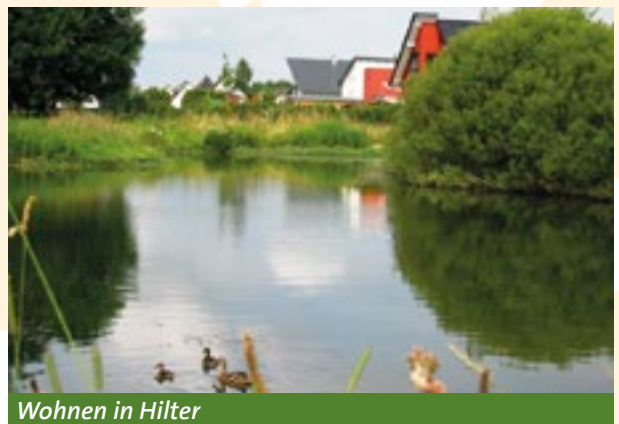
Wohnen in Hilter