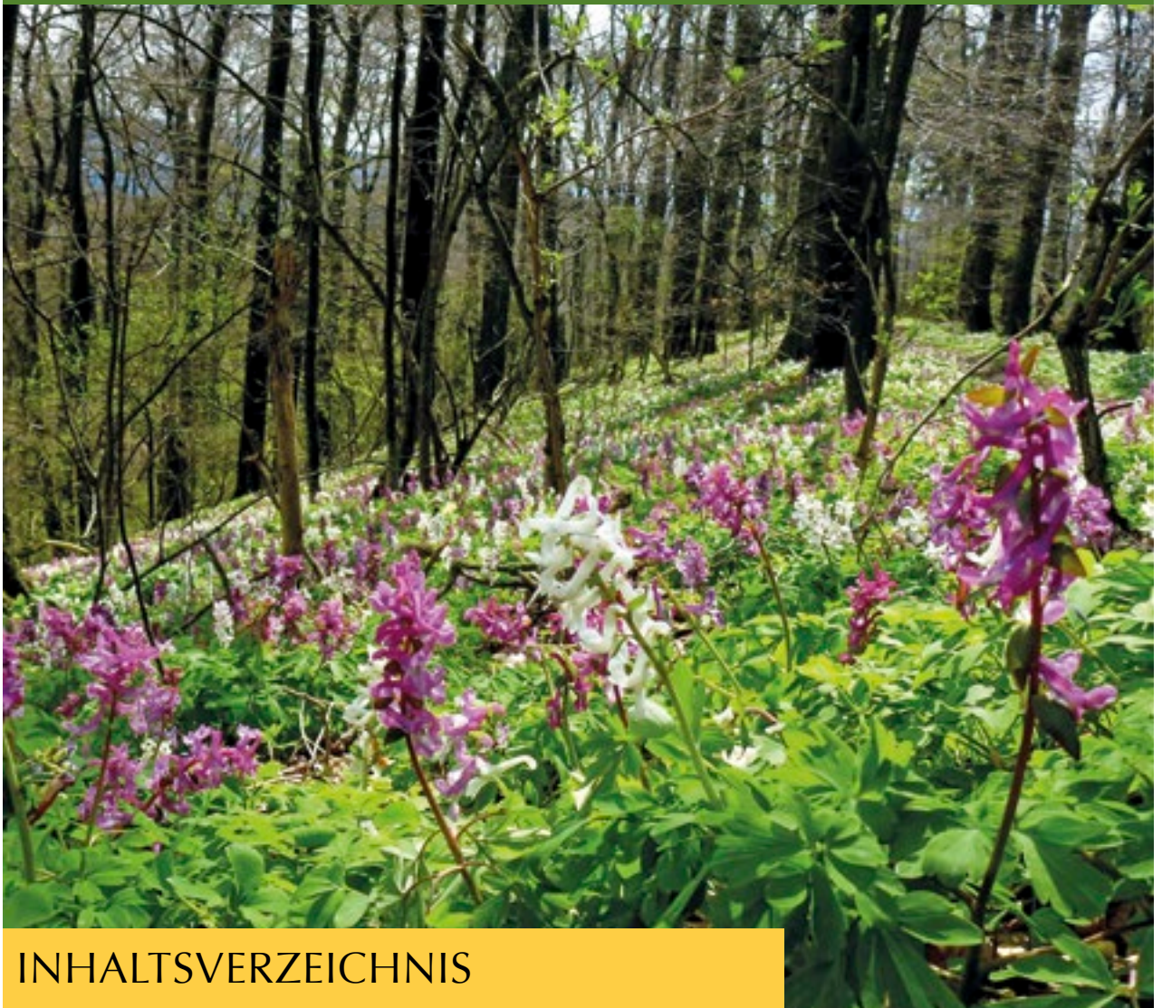
Lerchensporen auf dem Wehdeberg