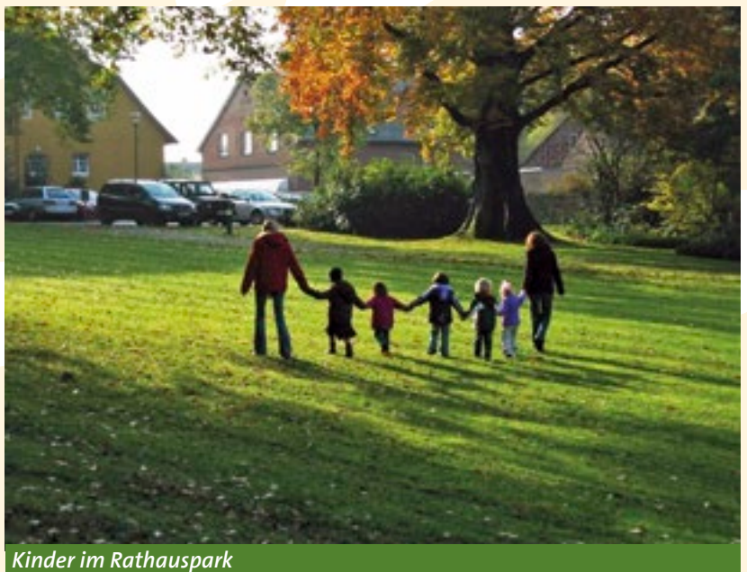
Kinder im Rathauspark