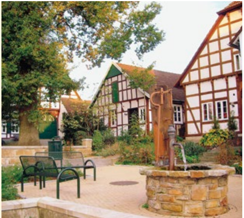
Fachwerkkulisse in Hilter

Sozialverband Deutschland – Ortsverband Borgloh Wilhelm Temmeyer Allendorfer Straße 2