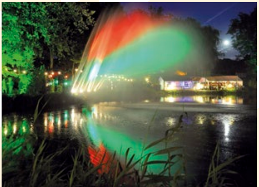
Seefest am Renkenörender See