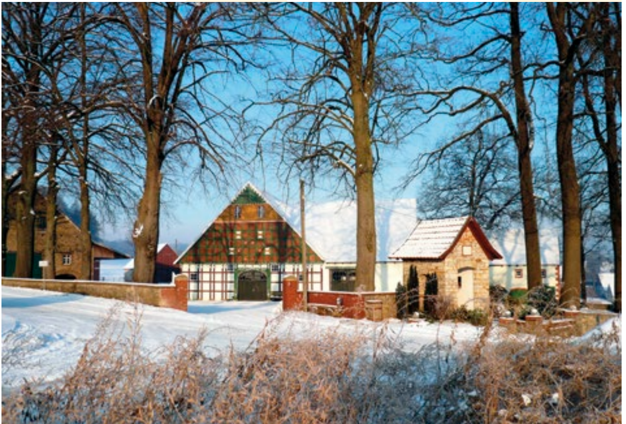
Hof Meyer zu Bergsten