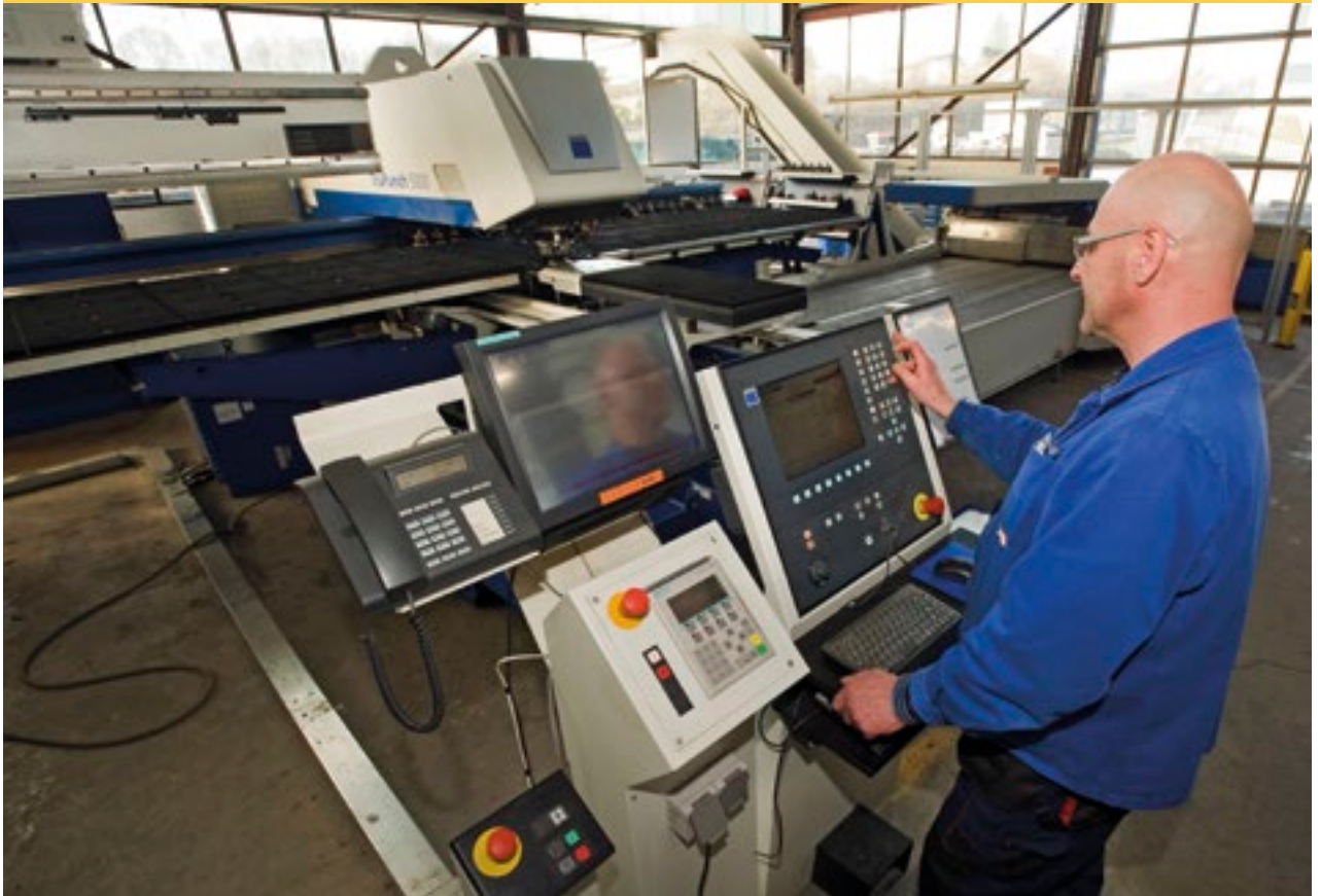
Produktion lufttechnischer Anlagen bei der Höcker Polytechnik GmbH