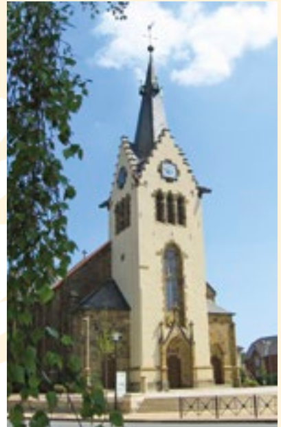
Ev. Kirche Hilter