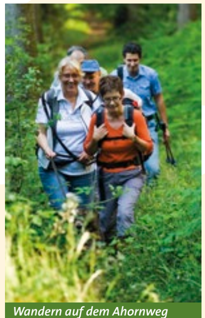
Wandern auf dem Ahornweg