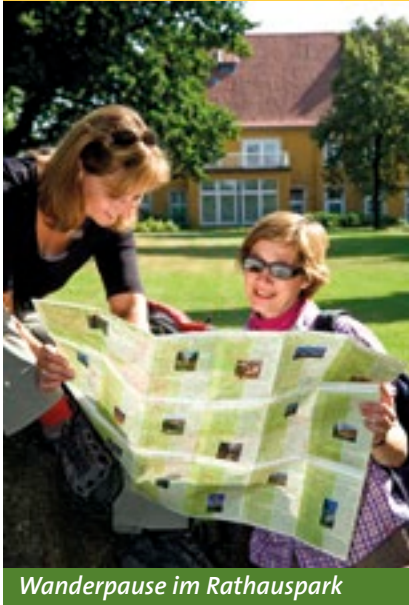
Wanderpause im Rathauspark

„Warum in die Ferne schweifen...?“ fragt sich der Volksmund mit gutem Grund frei nach Johann Wolfgang von Goethe. Schließlich reicht es völlig aus, die Wanderschuhe zu schnüren und gute Laune in den Rucksack zu packen, um die schönsten Schätze nahezu vor der eigenen Haustür zu entdecken – auf dem Wanderweg „Rund ümme Hilter“ etwa.