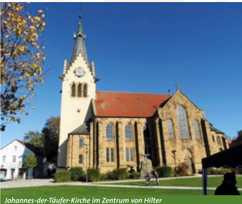
Johannes-der-Täufer-Kirche im Zentrum von Hilter

Steile Satteldächer geben der katholischen Pfarrkirche St. Barbara im Ortsteil Wellendorf ihr markantes Aussehen. Im Jahre 1924 wurde der im neuromanischen Stil errichtete Bau fertiggestellt, der in Anlehnung an die Steinkohlevorkommen in der Umgebung der Schutzpatronin der Bergleute geweiht wurde.