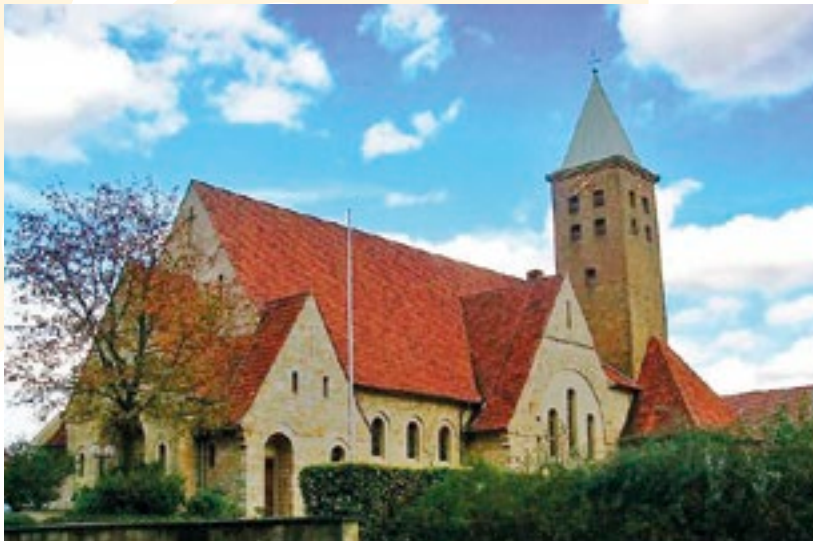
Kirche St. Barbara in Wellendorf