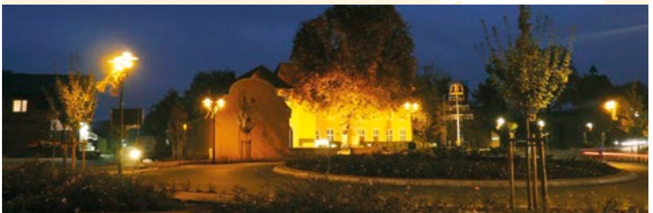
Blick vom Ockerplatz zum Rathaus