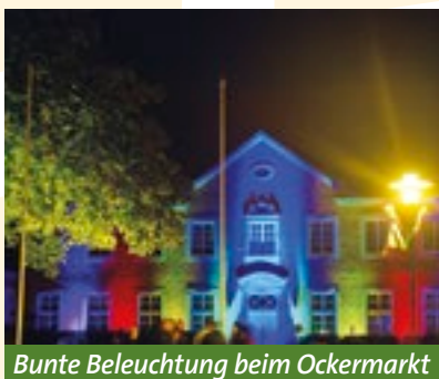
Bunte Beleuchtung beim Ockermarkt

Brautpaare werden von den Aktiven des Heimatvereins Borgloh angeboten.