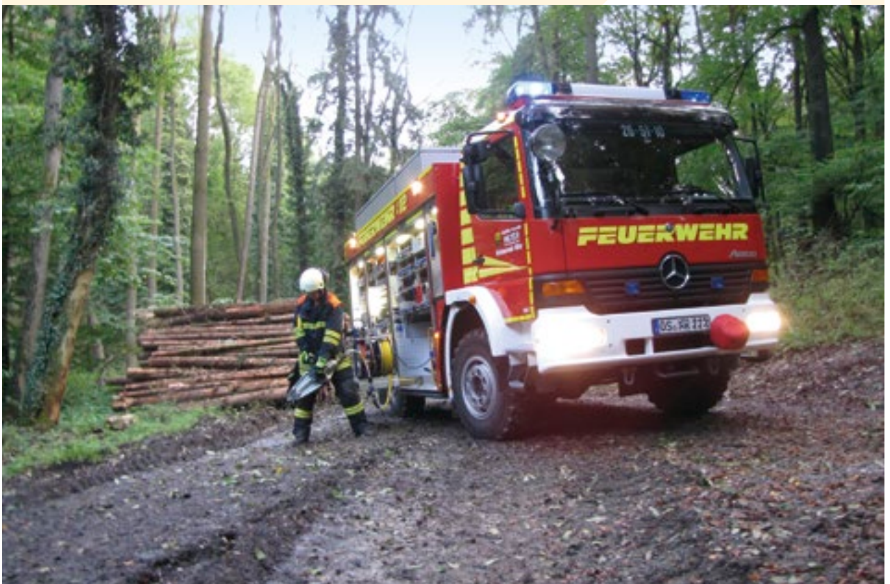
Rüstwagen im Einsatz

Altersabteilung heißt unterdessen nicht „auf dem Altenteil“. Denn das freiwillige, begeisterte und dabei unentgeltliche Engagement in Hilter kennt keine Altersgrenze. Und so machen sich Ehrenamtliche aller Generationen immer wieder in vielfältiger Weise um die Gemeinschaft verdient.