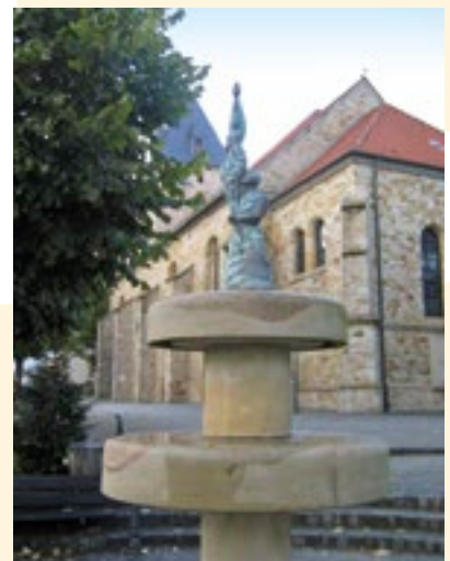
Brunnen vor St. Pankratius Borgloh

Einen Aufschwung nahm Hilter um die Jahrhundertwende durch die Ockergewinnung sowie durch die Margarinefabrik Rau, die bis nach dem Zweiten Weltkrieg eine große Walfangflotte besaß.