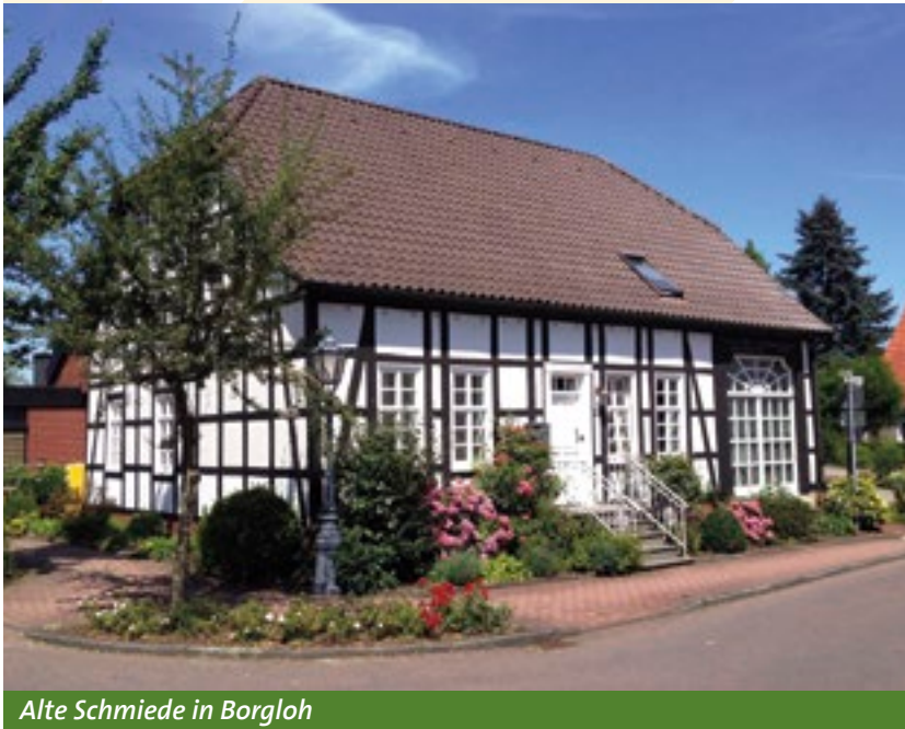
Alte Schmiede in Borgloh

Als ältester Ortsteil beging Borgloh bereits im August 1968 sein 900-jähriges Jubiläum. Seine Geschichte reicht bis zurück in die Zeit Karls des Großen, der einen befestigten Meierhof als Keimzelle des Ortes anlegte. Der Hof selbst brannte vermutlich um das Jahr 1200 bei einer Feuersbrunst nieder. Zwar wurde die Anlage wieder aufgebaut, die meisten Bürger des noch kleinen Ortes zogen jedoch nach dem Unglück hinauf auf den Berg. Dort erhob sich bereits ein steinerner Wachturm, der einst auf Befehl des Kaisers Barbarossa errichtet worden sein soll.