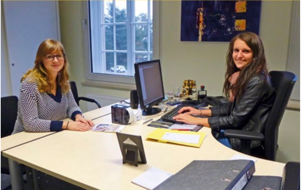
Bürgerservice im Rathaus