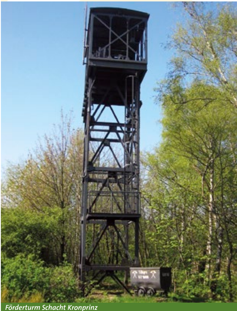
Förderturm Schacht Kronprinz

Und der nahm seinen Weg immerhin bis nach Amerika. Allein im Jahre 1885 wurden über 300 Tonnen des goldgelben Pulvers verschifft. Der Abbau wurde in den 1920er Jahren eingestellt, als die Industrie begann, den Farbstoff synthetisch herzustellen. Die Erinnerung an die goldgelbe Epoche jedoch bleibt und wird alljährlich beim Ockermarkt nach Kräften gefeiert.