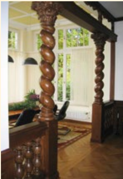
Trauzimmer im Rathaus