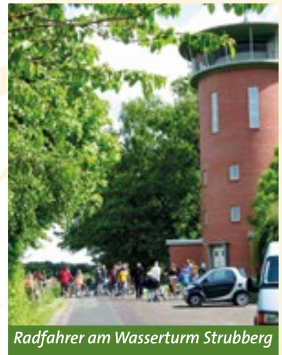
Radfahrer am Wasserturm Strubberg

trails auch durch die Gemeinde Hilter: Auf insgesamt 40 Fahrradkilometern durch Hilter und die Bäder des Südkreises lassen sich auf dem Terra.trail Nr. 15 „Sand, Salz und sonderbare Steine“ erkunden. Die „Borgloher Schweiz“ erkundet die „Borgloher Schweiz“ und ihre Bergbaugeschichte“ bringt der Terra.trail Nr. 14 auf 20 Kilometern den Radlern näher. Weitere Informationen gibt es im Rathaus Hilter oder unter www.naturpark-terravita.de .