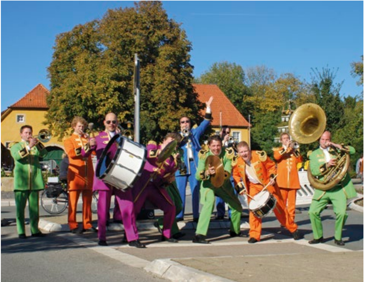
Strassenfest auf der Ockermeile

Skulpturen setzen dabei rund um den See künstlerische Akzente. Musik, Wasserspiele und – am Sonntagnachmittag – selbst gebackene Kuchen und Torten vom Heimatverein lohnen den Besuch. Der Renkenörender See ist über die Abfahrt Borgloh/Kloster Oesede der A33 in Richtung Borgloh zu erreichen.