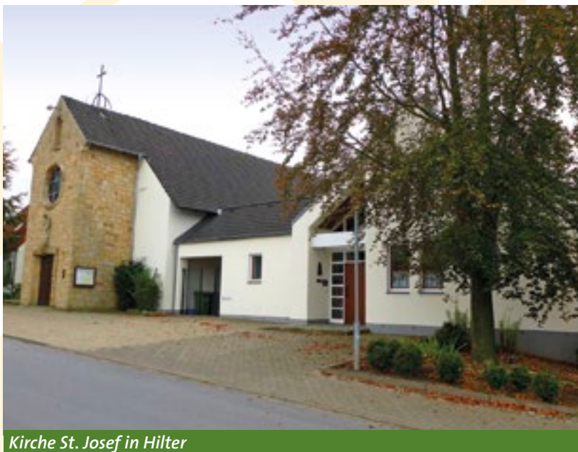
Kirche St. Josef in Hilter