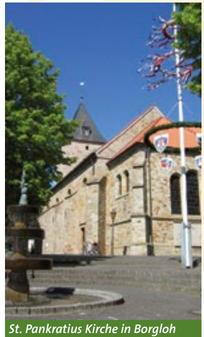
St. Pankratius Kirche in Borgloh