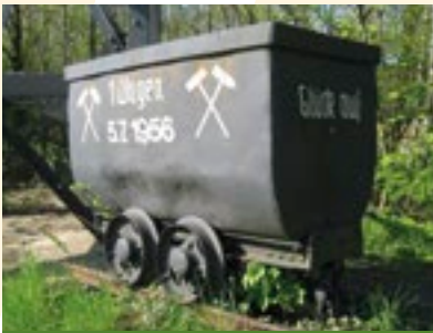
Alte Lore beim Förderturm Schacht Kronprinz

An den Steinkohlebergbau in Wellendorf erinnert der ausgediente Förderturm der Zeche Kronprinz. In den Jahren 1955/56 wurde er unweit seines heutigen Standortes auf dem Kronprinzschacht errichtet, aus dem 1963 die letzte Kohle gefördert wurde. Damit wurde die letzte Steinkohlenzeche Niedersachsens geschlossen. Bereits 1903 wurde in Hankenberge in der Zeche Hilterberg der Betrieb eingestellt.