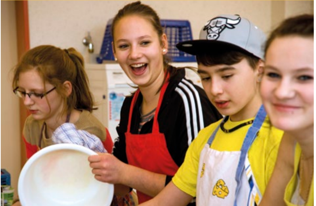
Schüler der Oberschule Hilter