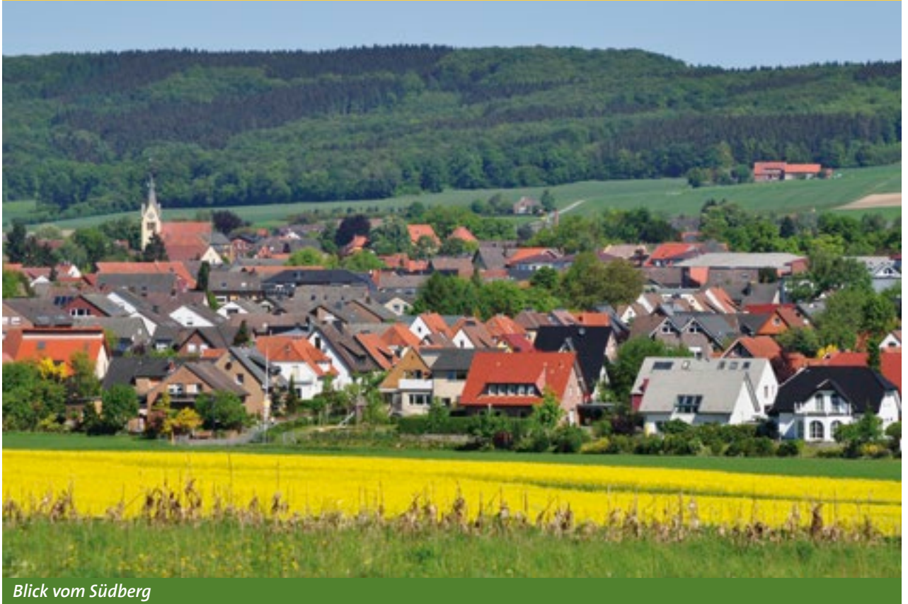
Blick vom Südberg

Mitten im Naturpark „TERRA.vita“-Nördlicher Teutoburger Wald-Wiehengebirge“ und umgeben von den Bädergemeinden des südlichen Landkreises liegt die Gemeinde Hilter. Eine waldreiche Hügellandschaft, grüne Wiesen und Ortsteile mit individuellem Charakter prägen die Gemeinde, die in ihrer heutigen Form im Zuge der Gebiets- und Verwaltungsreform im Jahre 1972 aus den früheren Gemeinden Borgloh, Hankenberge und Hilter entstand.